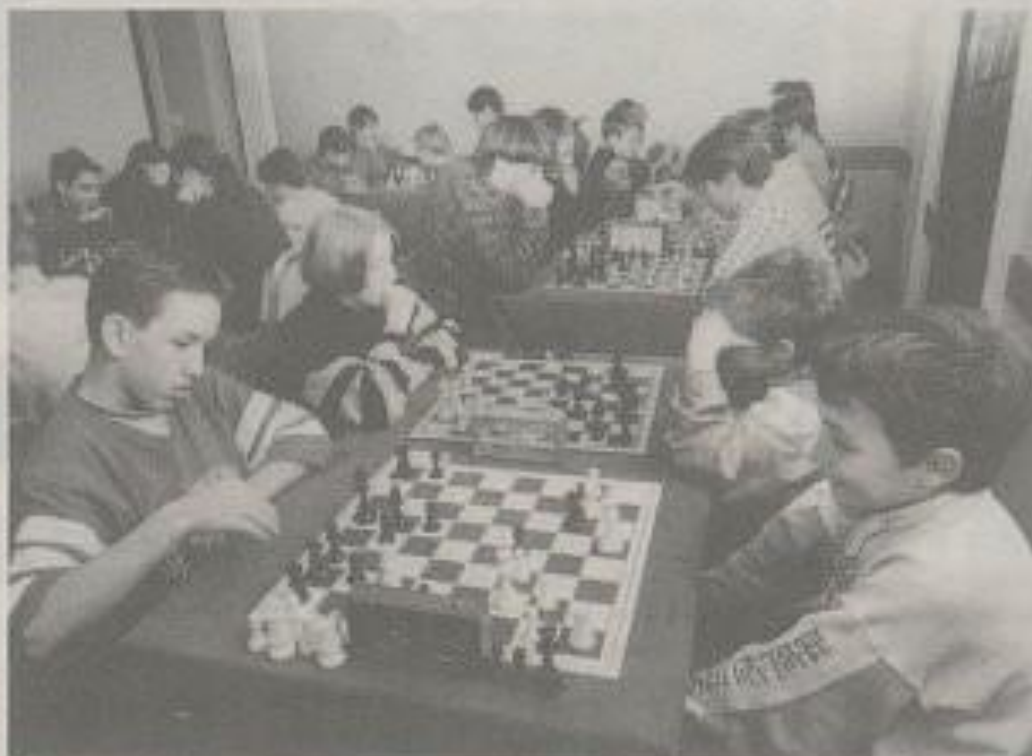
On rit du bon coup joué à l'adversaire... (premier plan à droite). HV-Martin