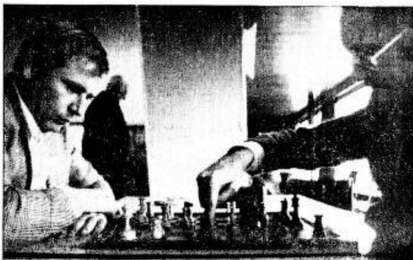
Concentration, technique et finesse, tels sont les caractéristiques de ce sport.